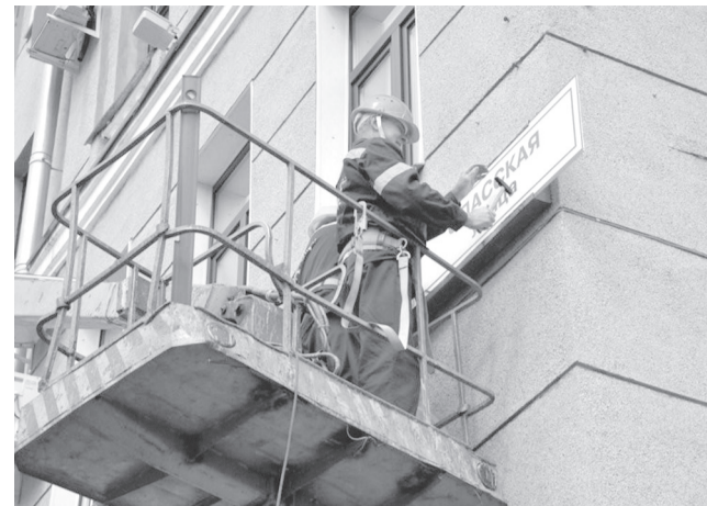
Безымянная улица в Засвияжском районе приобретает официальное название 154-й стрелковой дивизии, а в селе Белый Ключ северо-западнее от дома №16 на улице Геологов появится переулочек Родниковый.