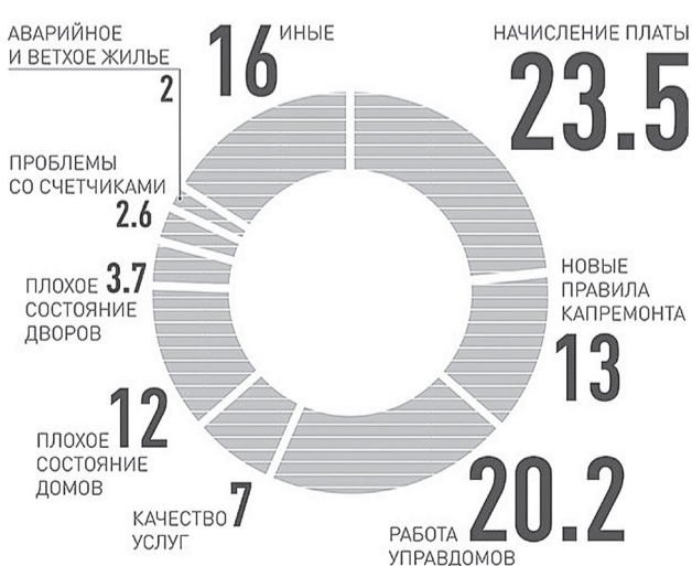
САМЫЕ ОСТРЫЕ ПРОБЛЕМЫ ЖКХ ПО МНЕНИЮ РОССИЯН, %

Ведут подготовку к отопительному сезону и другие теплоснабжающие организации региона. Напомним, что по распоряжению губернатора к 1 сентября готовность всех объектов к отопительному сезону должна составить 100%.