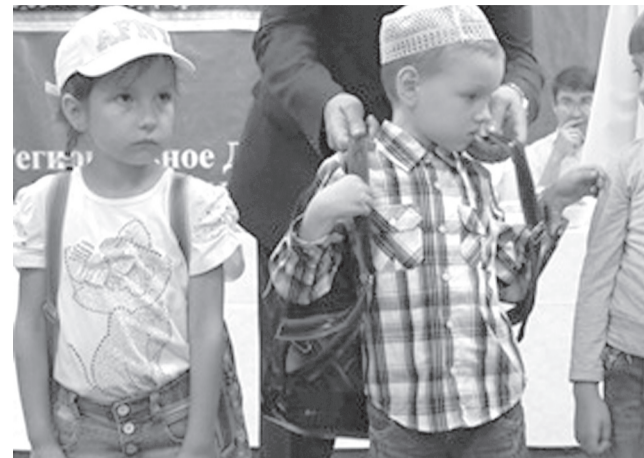
9754 ребенка Ульяновской области получили помощь в ходе проведения акции «Помоги собраться в школу». Это почти половина от общего количества детей, которым планировалось помочь в этом году.