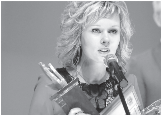
Восемь ульяновских педагогов получат по 200 тысяч рублей. Они стали победителями конкурса на поощрение лучших учителей, учрежденного по Указу Президента РФ в рамках реализации приоритетного национального проекта «Образование».