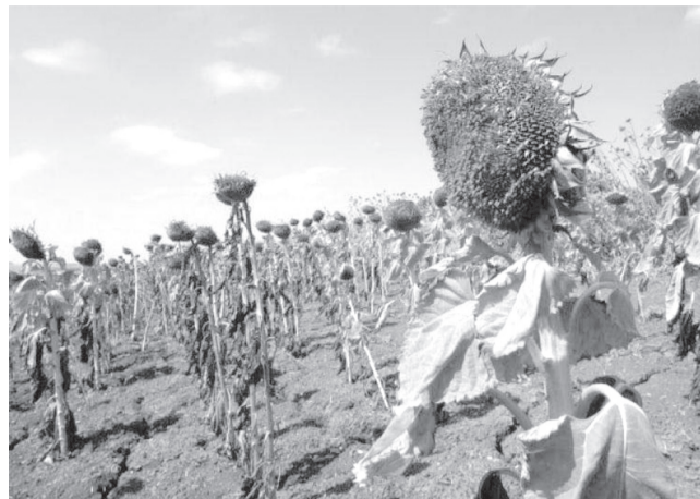
Площадь гибели посевов уже составила более 50 тысяч гектаров. Ущерб от потерянного урожая составит более 500 миллионов рублей.