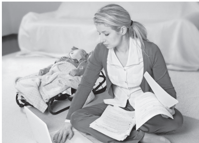
В области проходят профессиональное переобучение более 200 женщин, находящихся в отпуске по уходу за ребенком. Всего в этом году предусмотрено переобучение 300 молодых ульяновских мам. На реализацию данной программы в региональном бюджете заложено более 3,5 млн рублей.